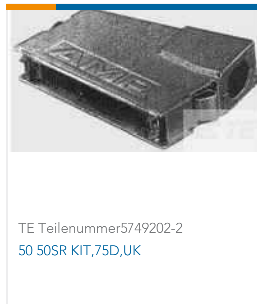
TE Teilenummer5749202-2 50 50SR KIT,75D,UK