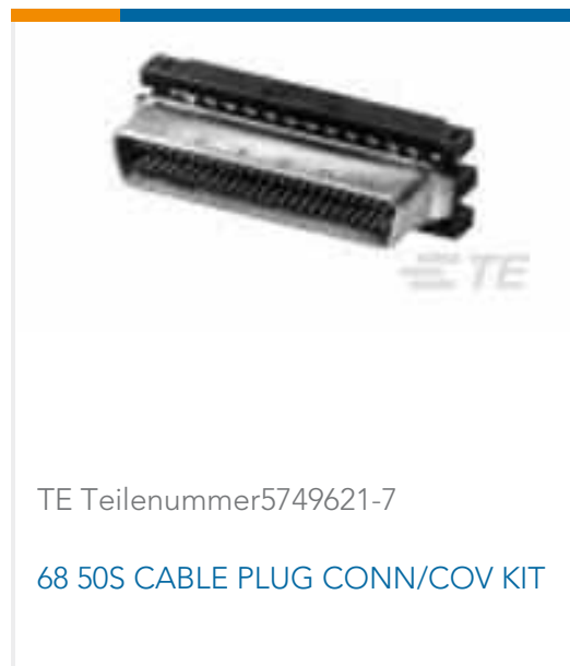
TE Teilenummer5749621-7 68 50S CABLE PLUG CONN/COV KIT