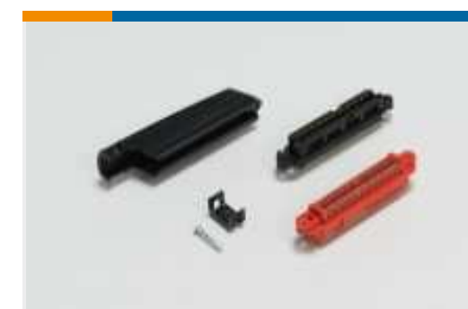
D-Sub-Steckverbinder mit Schneidklemmkontakten(77)