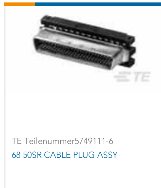
TE Teilenummer5749111-6 68 50SR CABLE PLUG ASSY