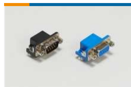
D-Sub-Steckverbinder für die Leiterplatte(199)