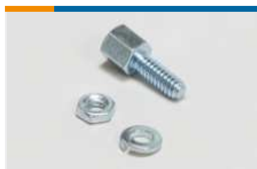
D-Sub-Verriegelung und -Befestigung (8)