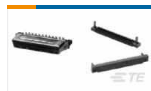
TE Teilenummer 1-5750913-7 68 50SR CABLE CONN KIT