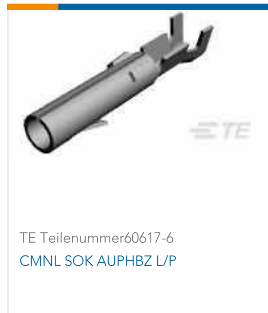
TE Teilenummer60617-6 CMNL SOK AUPHBZ L/P