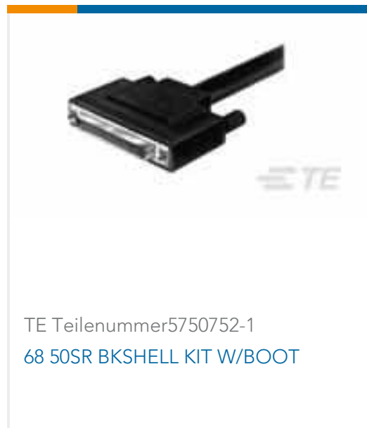
TE Teilenummer5750752-1 68 50SR BKSHELL KIT W/BOOT