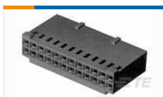
TE Teilenummer 87977-2 08 MODIV HSG DR MRKD .100 POL