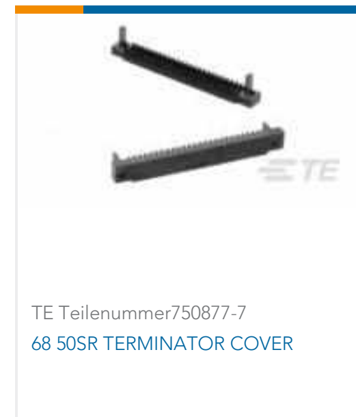
TE Teilenummer750877-7 68 50SR TERMINATOR COVER