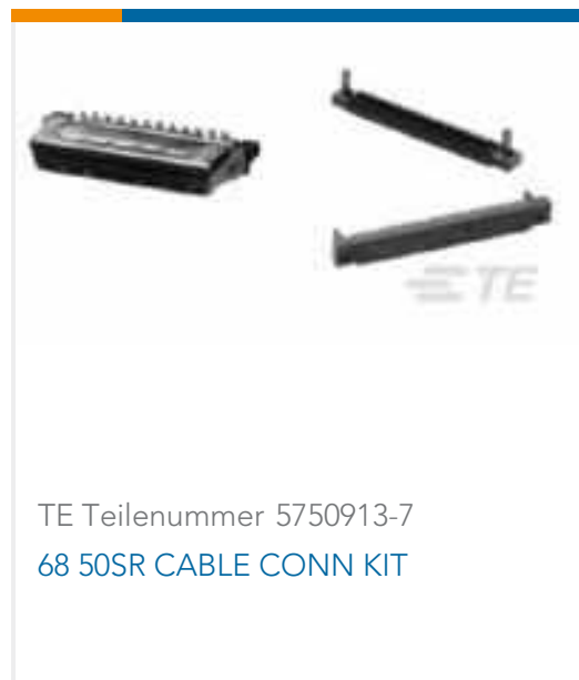
TE Teilenummer 5750913-7 68 50SR CABLE CONN KIT