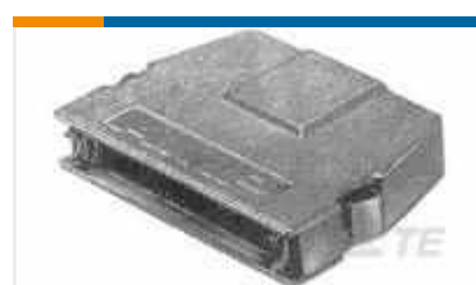
TE Teilenummer 5749195-2 68 50SR KIT,ST,UK