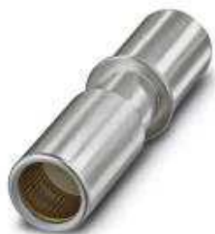
Crimpkontakt, gedreht, Kontaktdurchmesser: 10 mm, Crimpbereich: 16 mm 2 ... 16 mm 2

Bitte beachten Sie, dass die hier angegebenen Daten dem Online-Katalog entnommen sind. Die vollständigen Informationen und Daten entnehmen Sie bitte der Anwenderdokumentation. Es gelten die Allgemeinen Nutzungsbedingungen für Internet-Downloads. ( http://phoenixcontact.de/download )