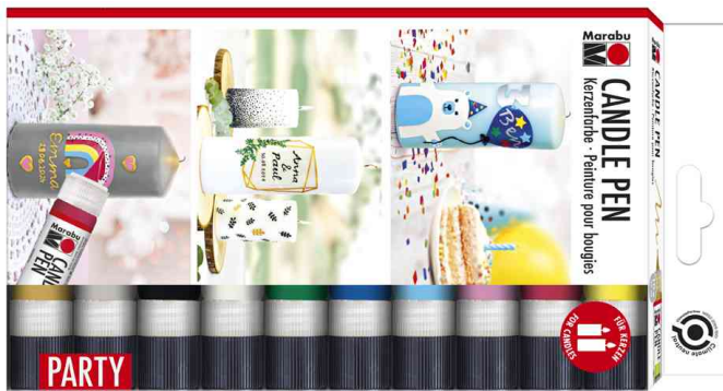
Peinture pour bougies "Candle Pen", set de 10