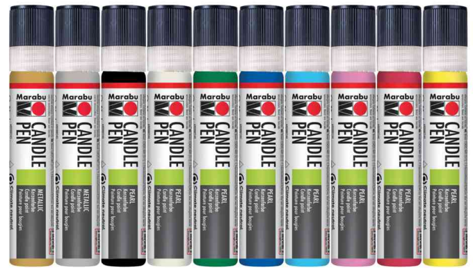
Aperçu des couleurs