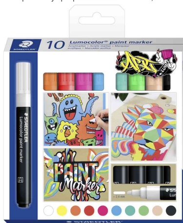
Marqueur acrylique paint marker Lumocolor, étui de 10