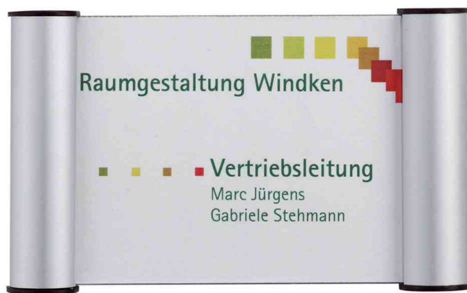
Türschild Clip, silber - Anwendungsbeispiel