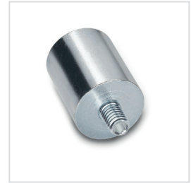
4 Form E mit Gewindezapfen