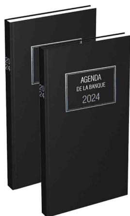
Agenda journalier Banquier Long - 2 volumes