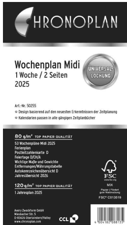
Wochenplan - Midi (50255)