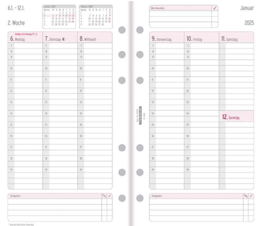
Wochenplan - Midi, Innenansicht (50545)