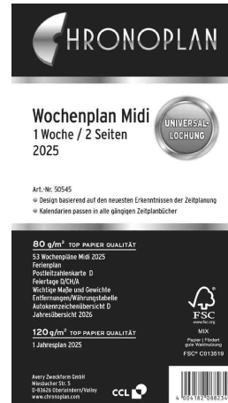
Wochenplan - Midi (50545)