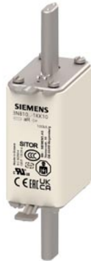
SITOR-Sicherungseinsatz Baugröße 0 32A aR 600V dc/900V VSI 750V dc UL @MBC 4xIn Messerkontakte