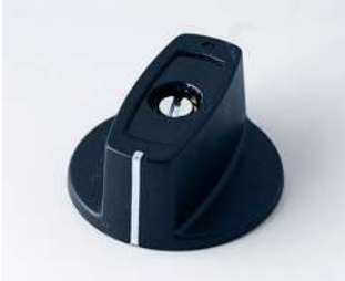
A2431060 KNEBELKNOPF 31, mit Strich ABS (UL 94 HB) schwarz RAL 9005 31x16mm 6mm