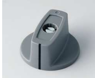
A2431068 KNEBELKNOPF 31, mit Strich ABS (UL 94 HB) staubgrau RAL 7037 31x16mm 6mm

Technische Änderungen vorbehalten. © OKW Gehäusesysteme, Buchen/Deutschland.