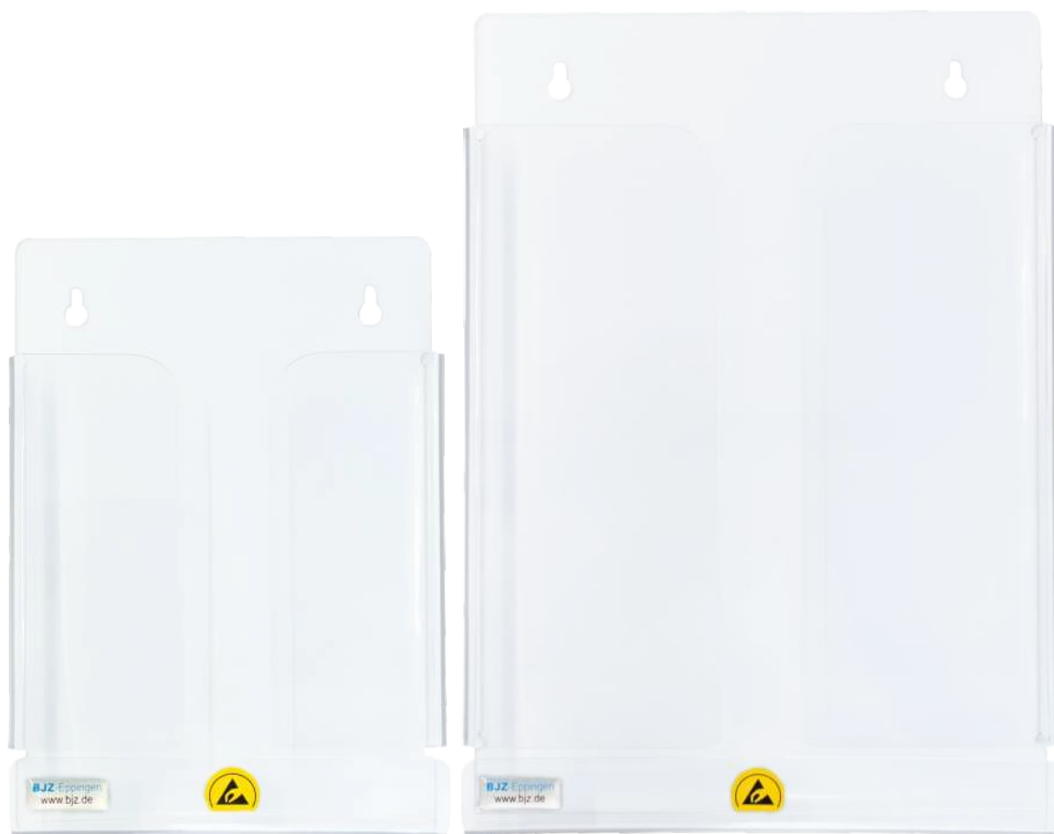
für DIN A5