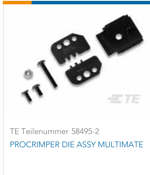
TE Teilenummer 58495-2 PROCRIMPER DIE ASSY MULTIMATE