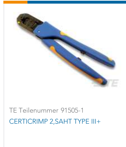
TE Teilenummer 91505-1 CERTICRIMP 2,SAHT TYPE III+