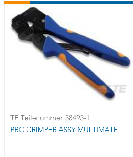
TE Teilenummer 58495-1 PRO CRIMPER ASSY MULTIMATE