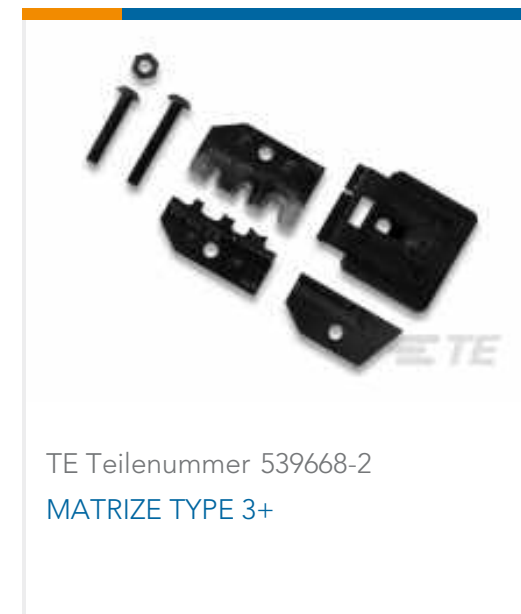
TE Teilenummer 539668-2 MATRIZE TYPE 3+