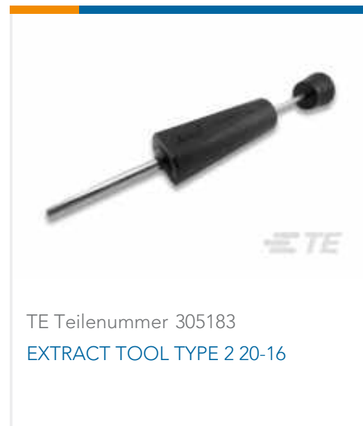
TE Teilenummer 305183 EXTRACT TOOL TYPE 2 20-16