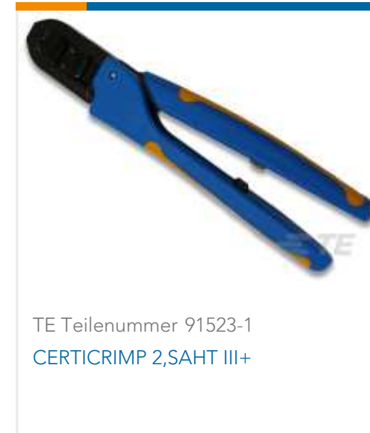
TE Teilenummer 91523-1 CERTICRIMP 2,SAHT III+