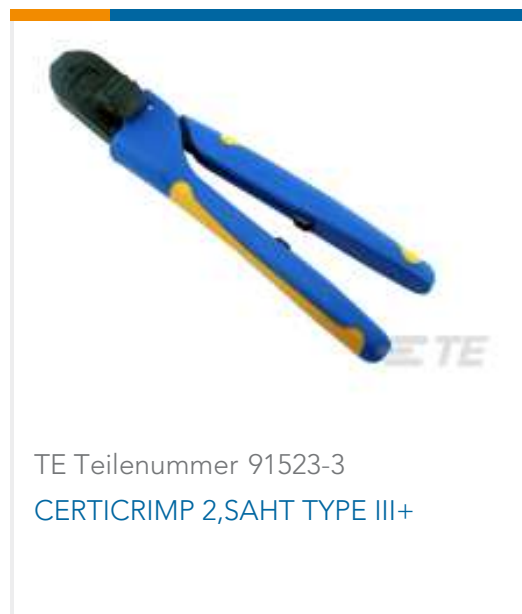
TE Teilenummer 91523-3 CERTICRIMP 2,SAHT TYPE III+