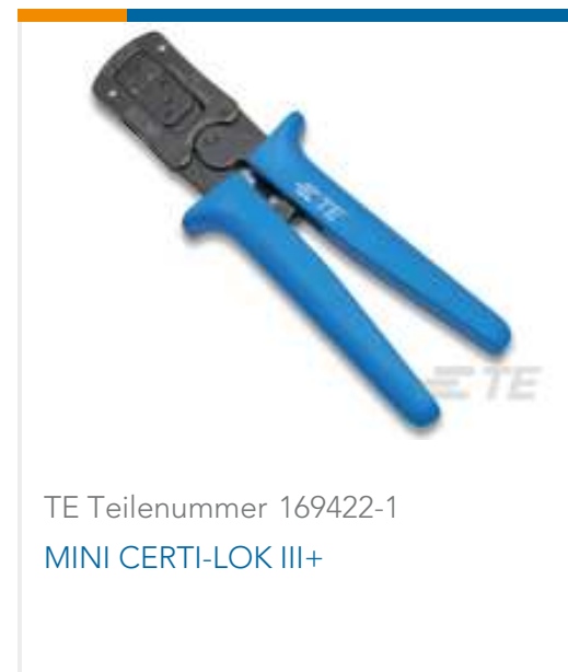
TE Teilenummer 169422-1 MINI CERTI-LOK III+