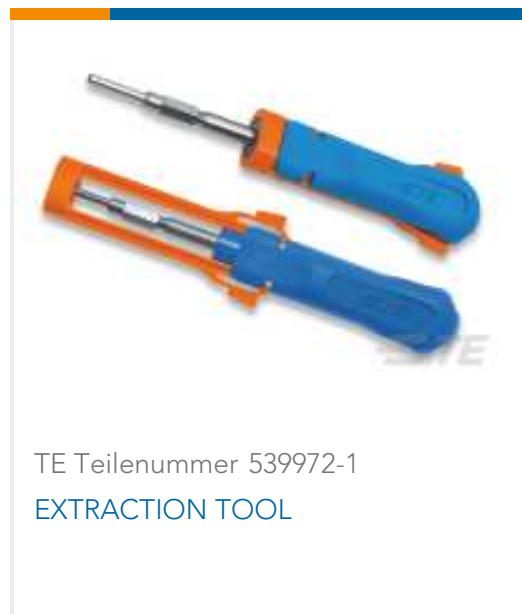
TE Teilenummer 539972-1 EXTRACTION TOOL