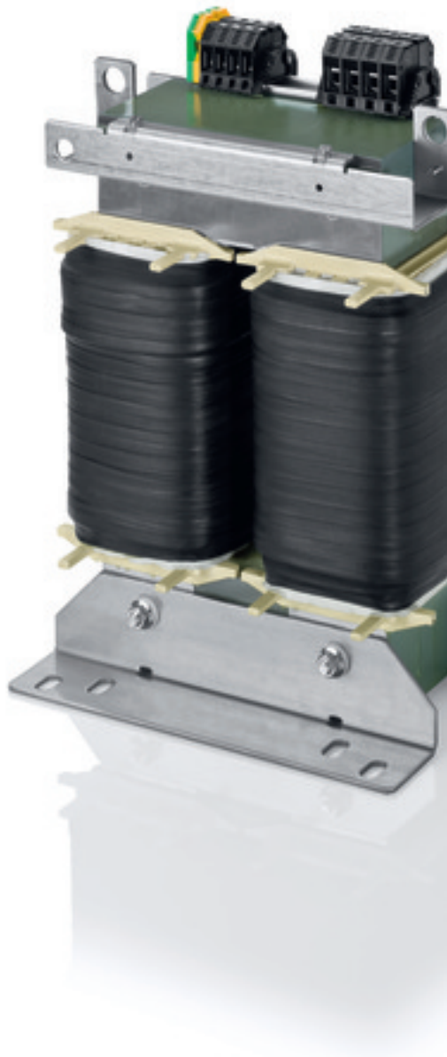
Abbildung zeigt TT1 20-4/23