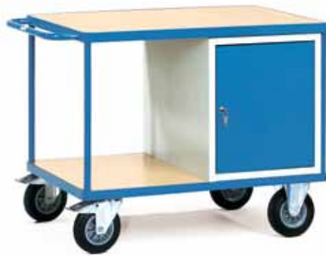
2432 | 2433