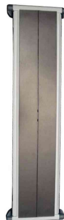
Support mural, magnétique - face arrière