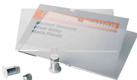
Contenu de la livraison