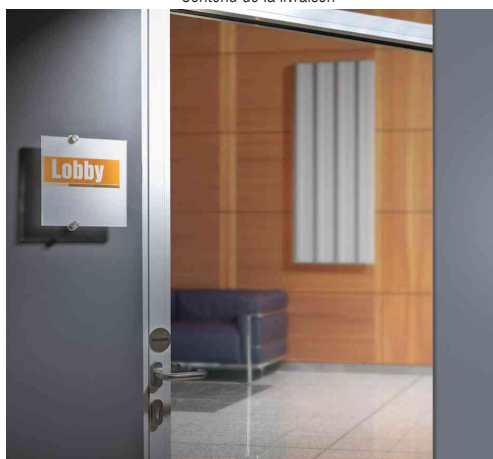
Plaque de porte CRYSTAL SIGN, exemple d'utilisation