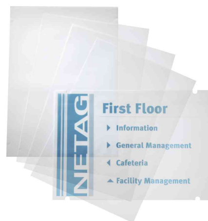
Accessoires: films CRYSTAL SIGN recharge