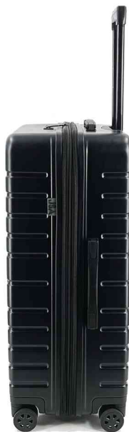
Trolley de voyage, vue latérale