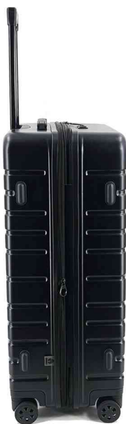
Trolley de voyage, vue latérale