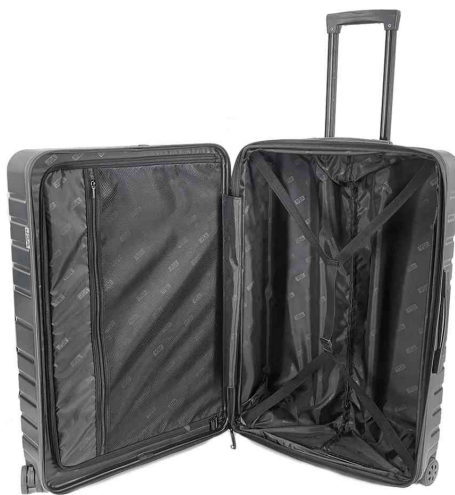
Trolley de voyage, ouvert