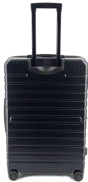
Trolley de voyage, vue de dos