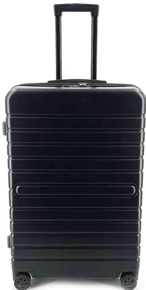
Trolley de voyage