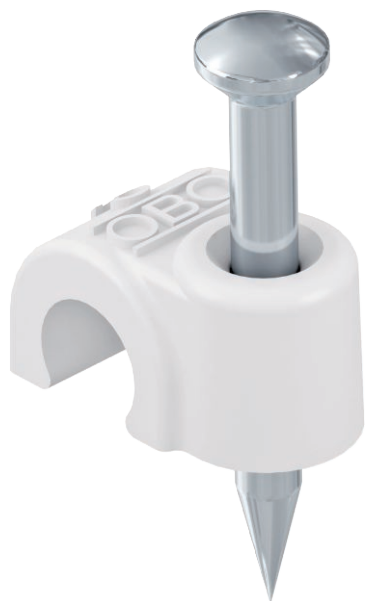
ISO-nagelclip, kort model