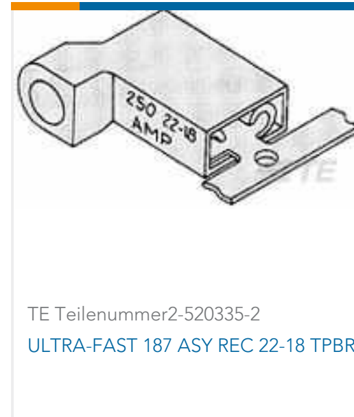
TE Teilenummer2-520335-2 ULTRA-FAST 187 ASY REC 22-18 TPBR