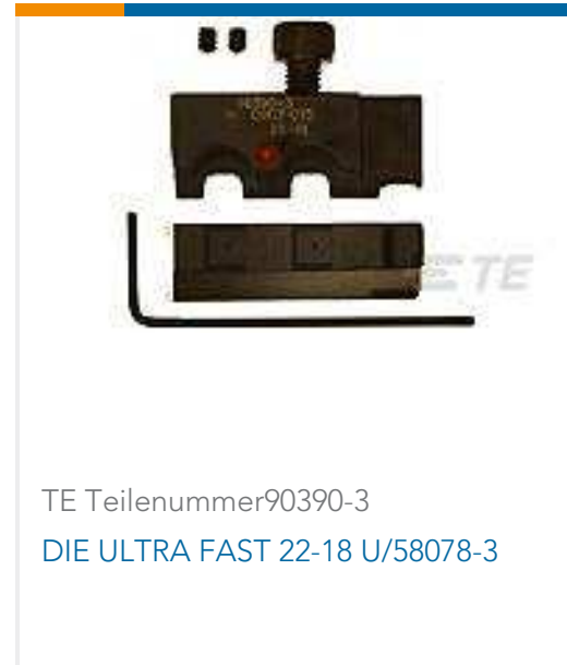
TE Teilenummer90390-3 DIE ULTRA FAST 22-18 U/58078-3