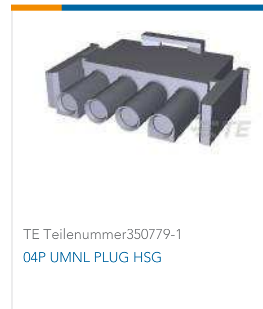
TE Teilenummer350779-1 04P UMNL PLUG HSG