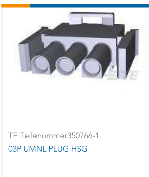
TE Teilenummer350766-1 03P UMNL PLUG HSG