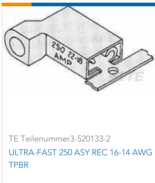
TE Teilenummer3-520133-2 ULTRA-FAST 250 ASY REC 16-14 AWG TPBR