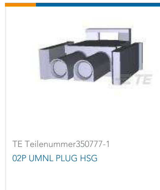
TE Teilenummer350777-1 02P UMNL PLUG HSG