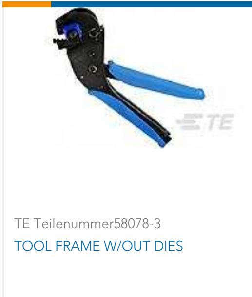
TE Teilenummer58078-3 TOOL FRAME W/OUT DIES