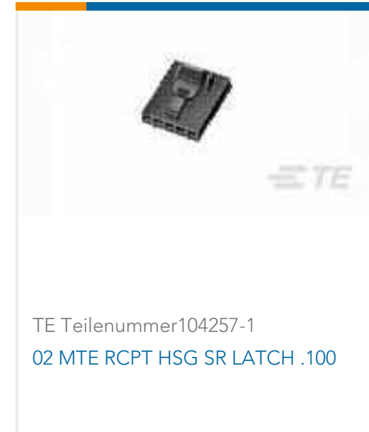
TE Teilenummer104257-1 02 MTE RCPT HSG SR LATCH .100