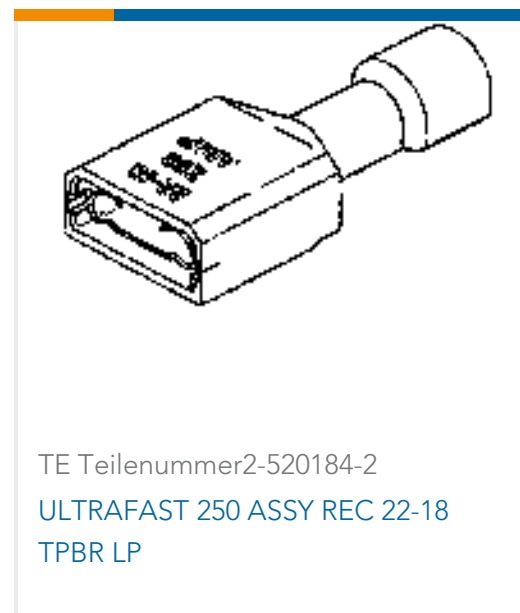
TE Teilenummer2-520184-2 ULTRAFast 250 ASSY REC 22-18 TPBR LP