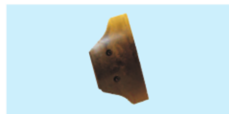
■ Schaberblätter / auswechselbar ■ Scraper blades / changeable