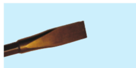
■ Flachmeißel 24 mm ■ Flat chisel