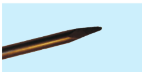
■ Spitzmeißel ■ Moil point