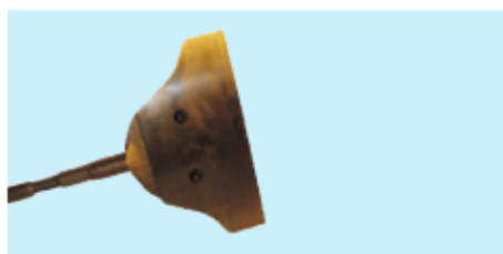
■ Schaber komplett 200 / 300 mm ■ Scraper complete