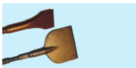
■ Flachmeißel 50 / 100 mm breit ■ Flat chisel