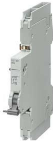
FEHLERSIGNALSCHALTER 1S+1OE,F.LS-SCHALTER NACH UL489