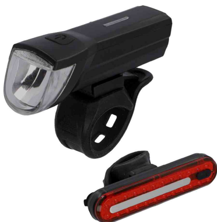
Set d'éclairage de vélo à LED rechargeable, 30 lux