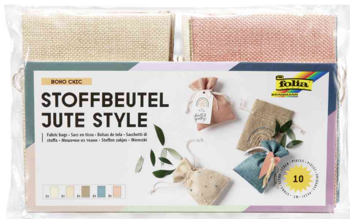
Sac de tissu Jute Style BOHO CHIC