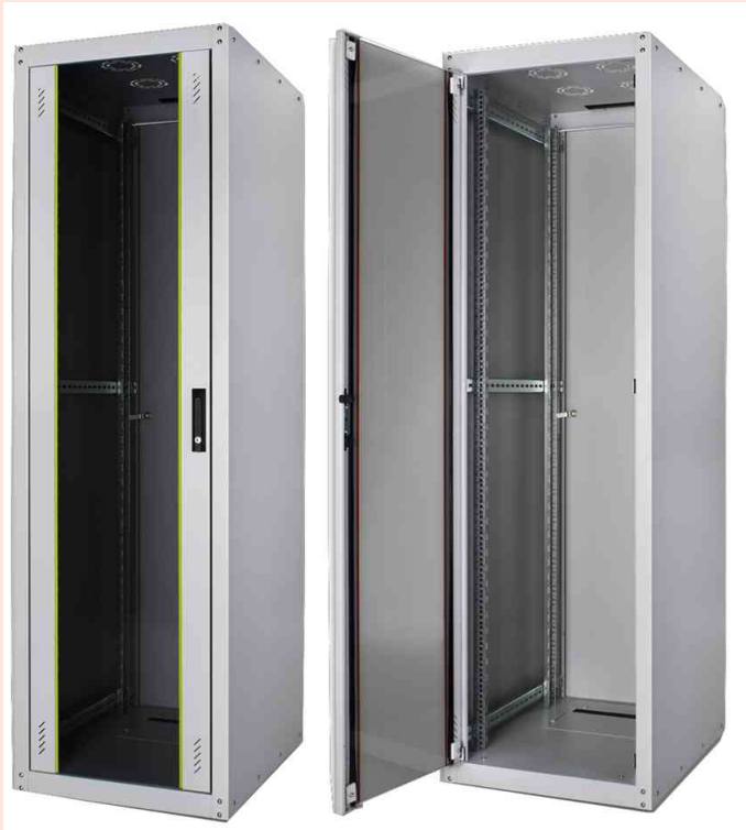
Eco-Line 19" Netzwerkschrank, Glastür

- geeignet für alle gängigen passiven EDV- und Telekommunikationsanwendungen