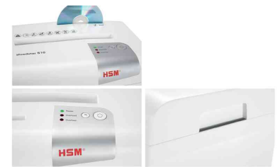
Details: Separates CD-Schneidwerk - Bedienelement - abnehmbares Oberteil