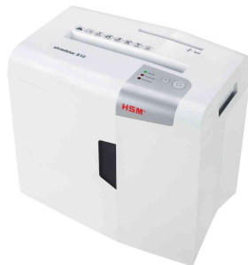
Aktivenrichter HSM shredstar S10

- für den privaten Gebrauch oder im kleinen Büro