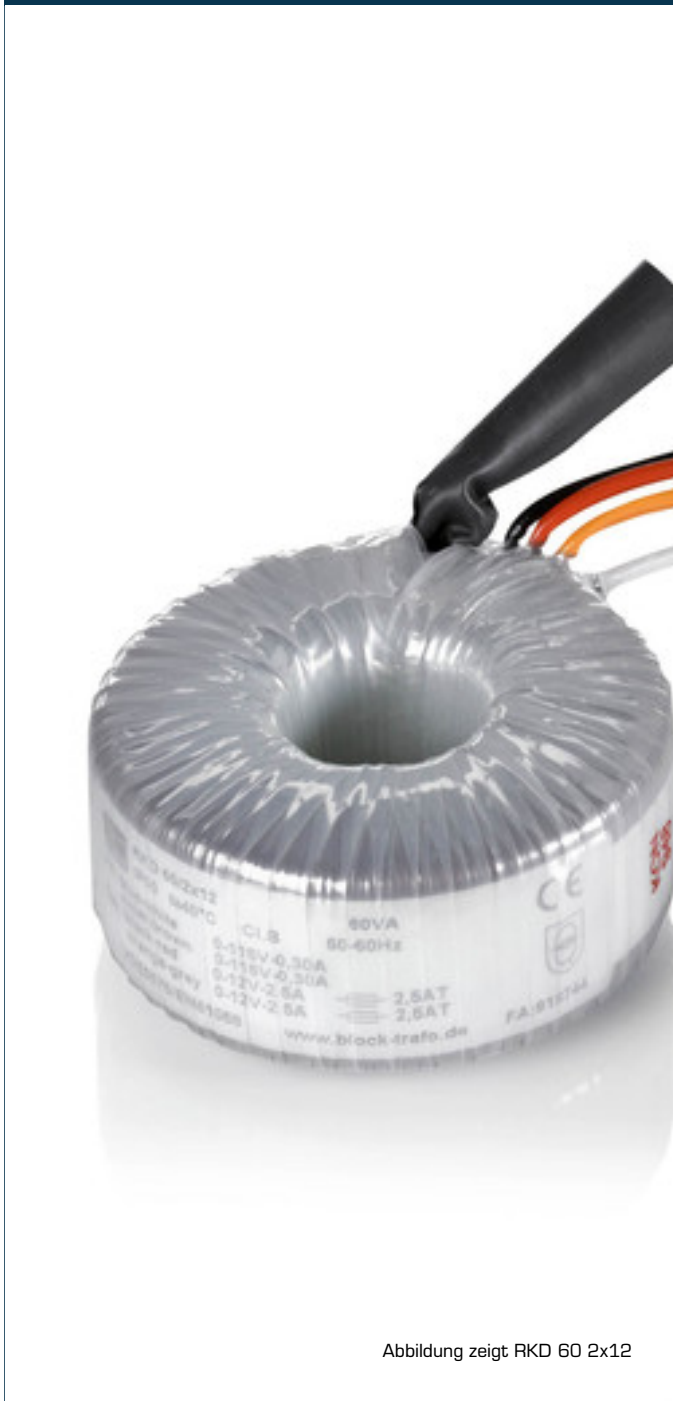
Abbildung zeigt RKD 60 2x12