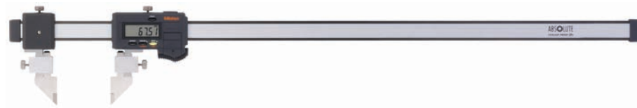
552-182-10 opcionális tartozékkal