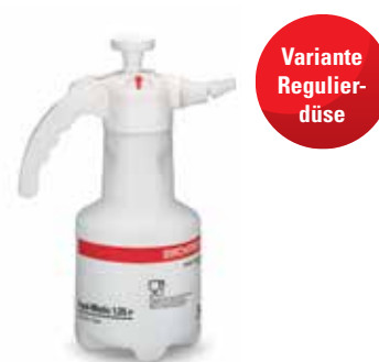
Food-Matic 1.25 P mit Regulierdüse Art.Nr. 11990801