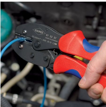
97 52 37

Sous réserve de toute modification technique et erreur.