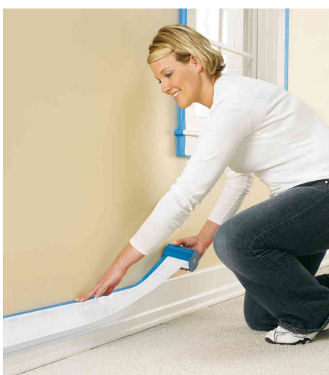
Visuel de référence: exemple d'utilisation