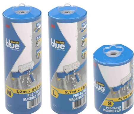
Visuel de référence: ScotchBlue Film de protection avec bande de peinture