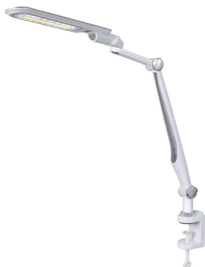
Lampe de bureau à LED Multiflex, avec pince