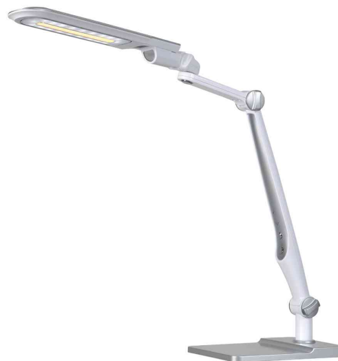
Lampe de bureau à LED Multiflex, avec socle