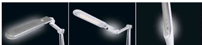
Vue détaillée - Tête de lampe / Commande