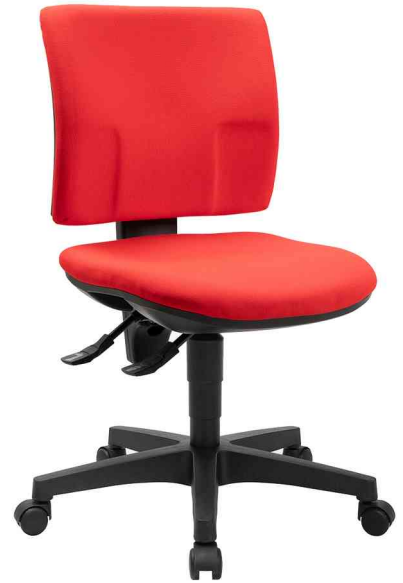
Bürodrehstuhl "PRO 30", rot