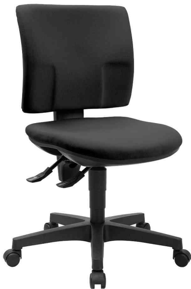
Bürodrehstuhl "PRO 30", schwarz