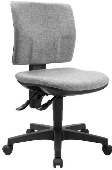
Bürodrehstuhl "PRO 30", hellgrau