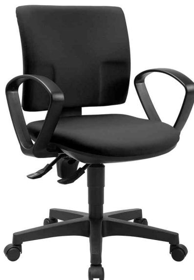
Bürodrehstuhl "PRO 30", inkl. optionale Armlehne B2(B)