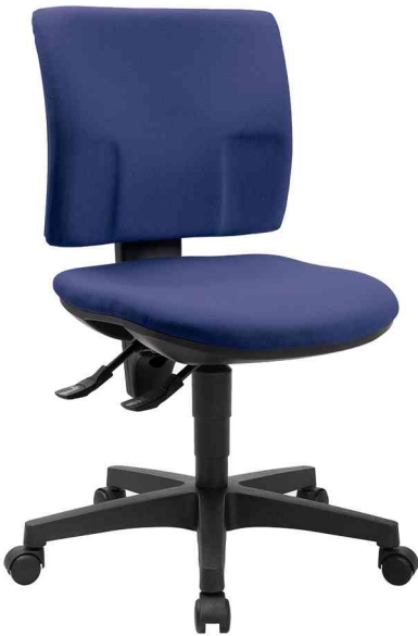
Bürodrehstuhl "PRO 30", blau