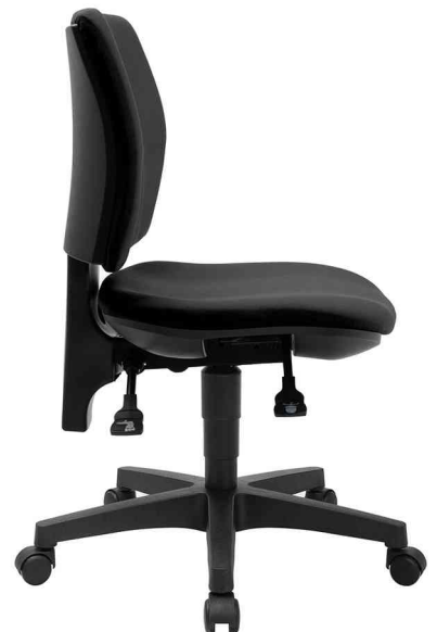
Bürodrehstuhl "PRO 30" - Seitenansicht