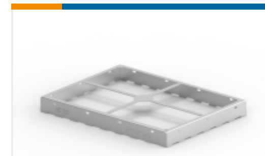
TE Teilnr.:2118732-2 STD SHIELD FRAME, CRS-50.80X38. 10X5.08MM