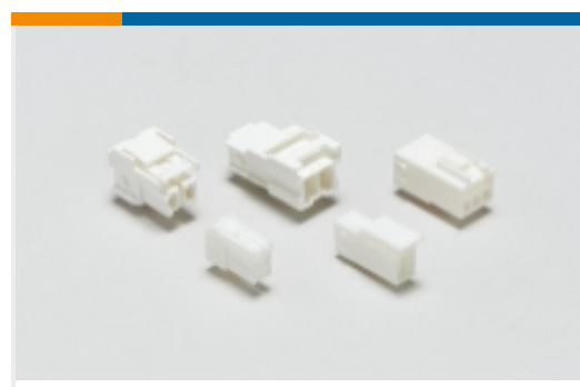
Rechteckige Leistungssteckverbinder (35)