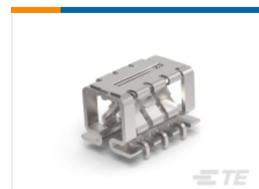
TE Teilnr.:1418578-2 BOTTOM-ENTRY SMC-PCB CONTACT