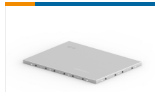
TE Teilnr.:2118731-2 STD SHIELD COVER, CRS-51.30X38. 60X2.00MM