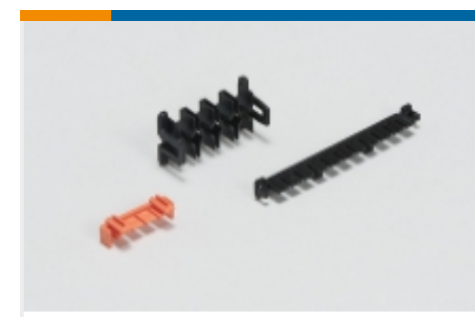
Verriegelung von rechteckigen Steckverbindern(2)