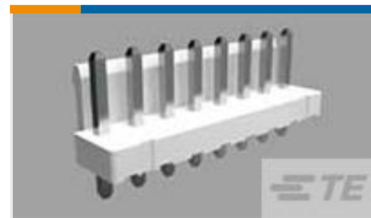
TE Teilnr.:1744037-2 02P EC PWR.200 CL HDR ASSY VRT