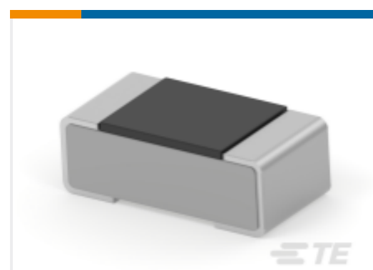
TE Teilnr.:4-2176338-3 CRGCO 0402 10M 5%