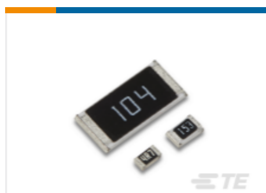
TE Teilnr.:3-2176337-8 CRGCO 0402 12K 1%