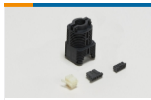
Rechteckige Steckverbindergehäuse (49)