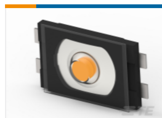
TE Teilnr.:2337224-1 TACT ULTRA TB 2.6X1.6X0.55 160GF