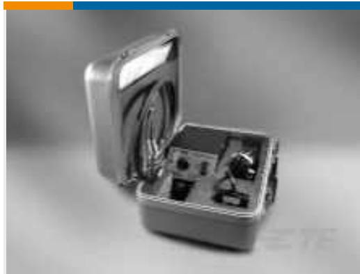
TE Teilnr.: 173643-000 RH-3960-1-TINEL-KIT-120V