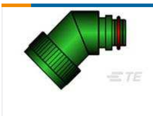
TE Teilnr.:CM9965-000 TXR40AC45-1812BI