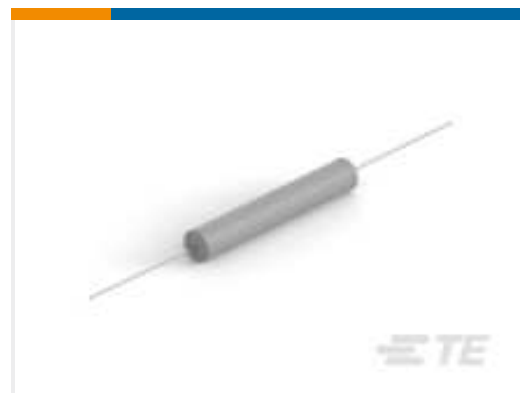
TE Teilnr.:4-2176416-5 9W STD M/OX 5% 3K6