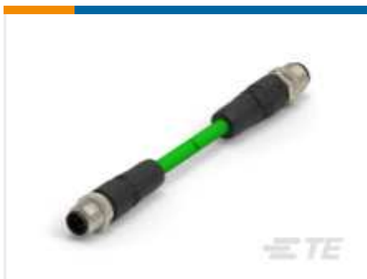
TE Teilnr.:TAD14747101-002 M12D4-MS-MS-FRNC TYPE B GREEN-1.0M