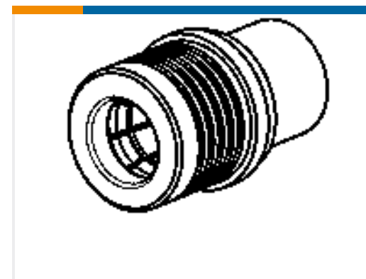
TE Teilnr.:619271-1 QMA Plug terminator