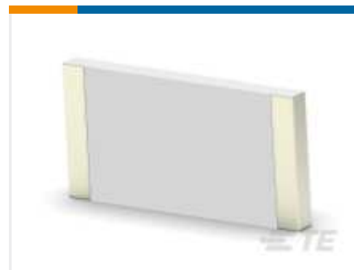
TE Teilnr.:4-2176246-5 CRGS2512 5% 4K7