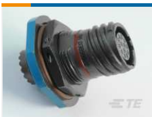
TE Teilnr.: YDTS24T23-35PAV001 RECP ASSY