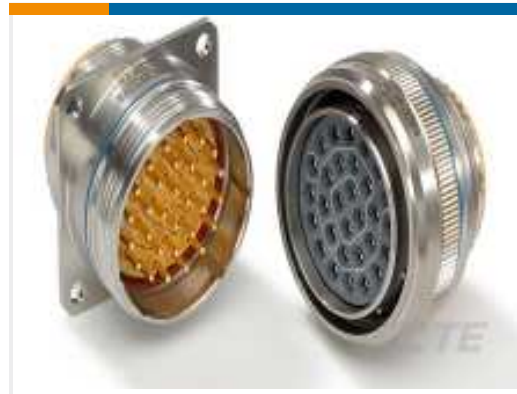
TE Teilnr.:ZPF000000000007728 983-0SE 24-61 PN-L