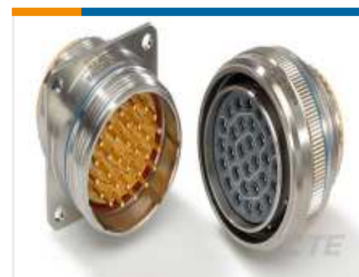
TE Teilnr.: ZPF000000000033936 983-05E 24-61 P6 L