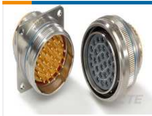
TE Teilnr.:ZPF0000000000033940 983-0SE 24-61 P8 L