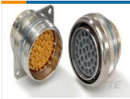
TE Teilnr.:ZPF0000000000033938 983-0SE 24-61 P7 L