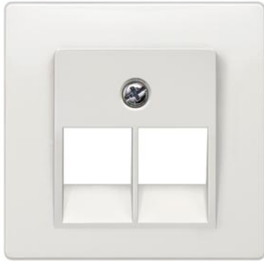
DELTA i-system titanweiß Abdeckung UAE-Kat.3, 2-fach 55x55mm