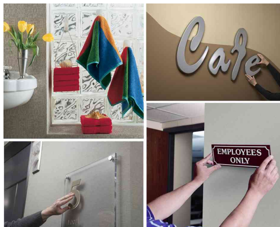
Visuel de référence: Exemples d'utilisation