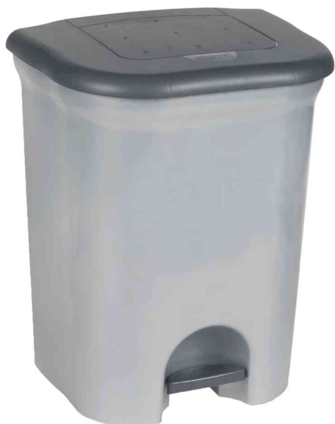
Poubelle à pédale "torge", 2 x 11 litres