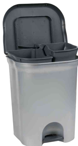
Poubelle à pédale "torge", 2 x 11 litres, ouvert