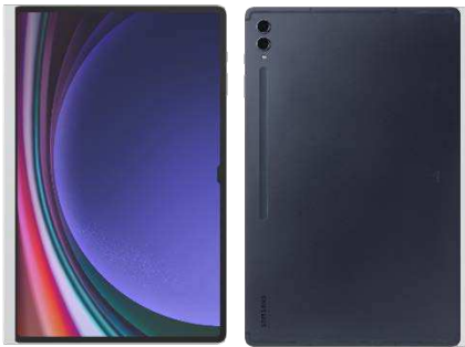
Note Paper Screen EF-ZX912