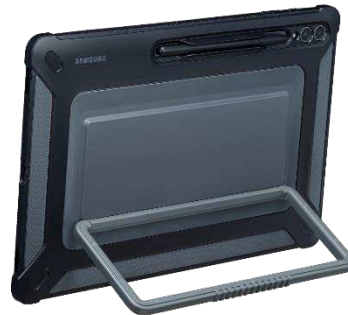
Outdoor Cover EF-RX910