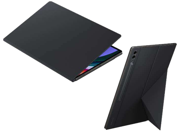
Smart Book Cover EF-BX910