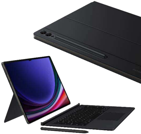
Book Cover Keyboard EF-DX915