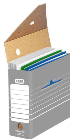
Boîte d'archives, (L)110 mm - livraison non équipée