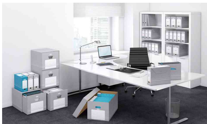
présente la série complète en application