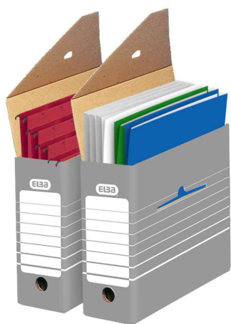
Boîte d'archives, (B)95 mm - livraison non équipée