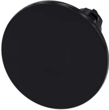
Pilzdrucktaster, 22 mm, rund, Kunststoff, schwarz, 60 mm, tastend