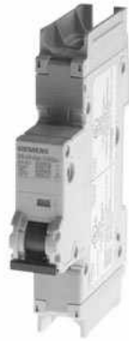
Leitungsschutzschalter 240V 10kA, 1-polig, D, 50A, T=70mm nach UL 489