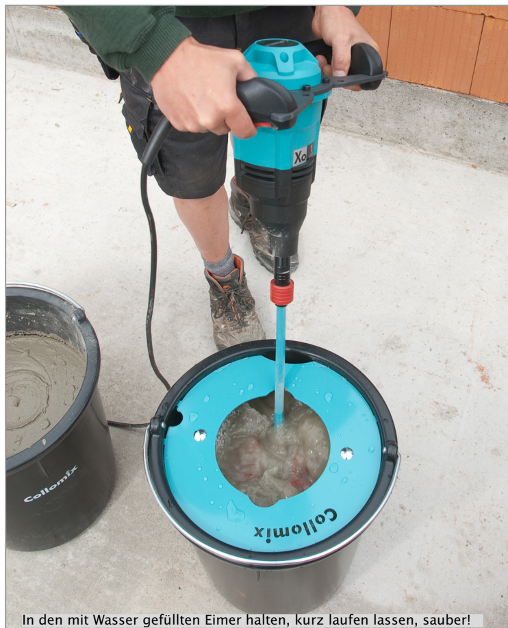
In den mit Wasser gefüllten Eimer halten, kurz laufen lassen, sauber!