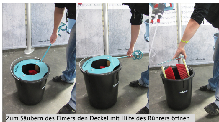
Zum Säubern des Eimers den Deckel mit Hilfe des Rührers öffnen