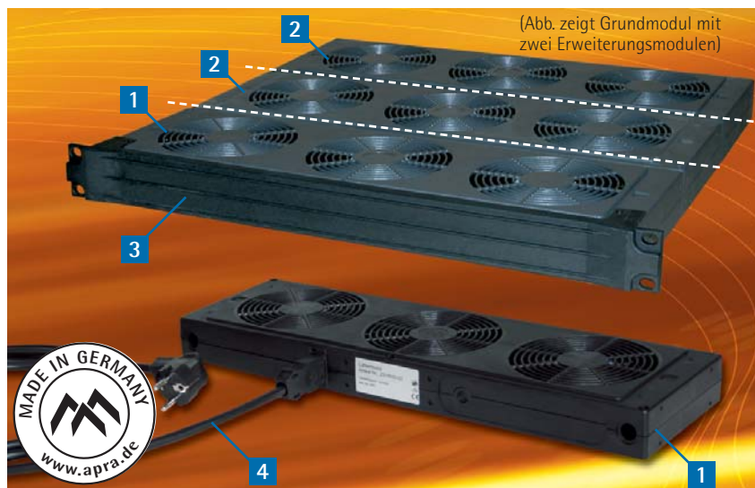
(Abb. zeigt Grundmodul mit zwei Erweiterungsmodulen)

Das Lüfter-Erweiterungsmodul ist ebenfalls als 1-, 2- oder 3-fache Einheit erhältlich und stellt eine steckbare mehrfache Erweiterung des Lüftergrundmoduls dar. Die mechanische Verbindung der Module erfolgt über Aluminium-Führungsbolzen (im Lieferumfang enthalten). Auf der Frontseite ist das Erweiterungsmodul mit einem Stecker, auf der Rückseite mit einer Buchse ausgestattet. So wird durch das Anreihen automatisch die elektrische Verbindung zwischen den Modulen hergestellt.