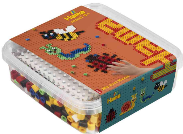
Bügelperlen maxi + Stiftplatte "Krabbeltiere", in Box

ACHTUNG! Nicht geeignet für Kinder unter 36 Monaten, wegen verschluckbarer Kleinteile.