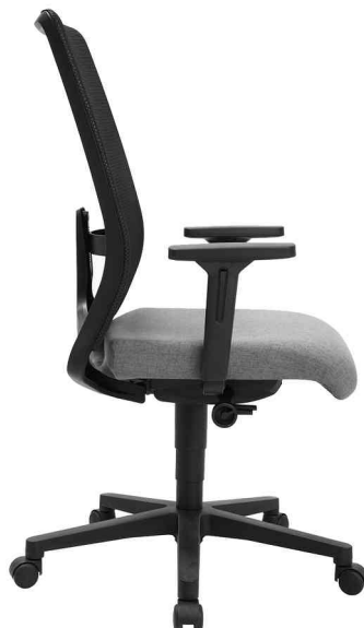
Bürodrehstuhl "Eurostar 200" - Seitenansicht