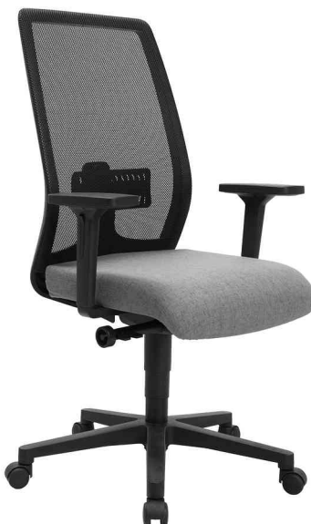
Bürodrehstuhl "Eurostar 200", hellgrau