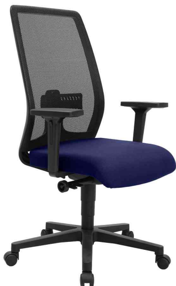
Bürodrehstuhl "Eurostar 200", blau