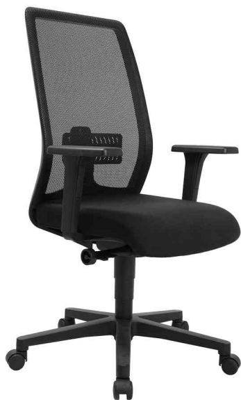
Bürodrehstuhl "Eurostar 200", schwarz