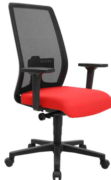
Bürodrehstuhl "Eurostar 200", rot