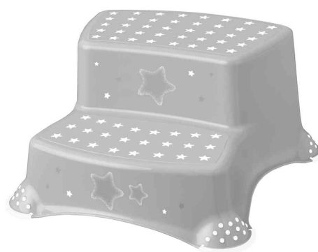
Marchepied "igor stars", gris