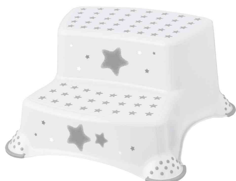
Marchepied "igor stars", blanc

Vous trouverez d'autres produits dans la série pour bébé "stars"!