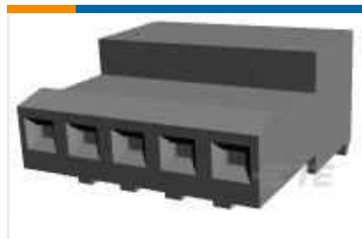
TE Teilenummer3-643498-5 05P MTA100 CONN ASSY LF