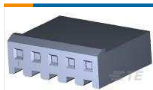
TE Teilenummer647401-5 05P SL156 HSG W/RAMP,LRG OPEN