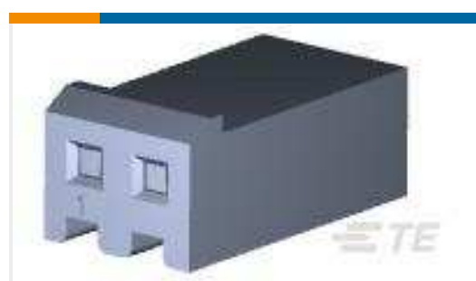
TE Teilenummer647401-2 02P SL156 HSG W/RAMP,LRG OPEN