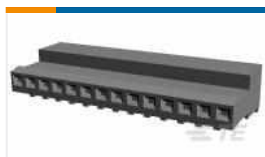
TE Teilenummer4-643498-4 14P MTA100 CONN ASSY BLK LF