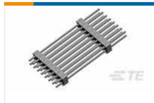
TE Teilenummer829822-8 2X 8P MOD2 STIFTLI