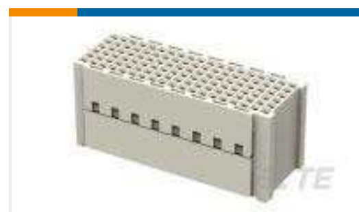
TE Teilenummer1-2102061-4 Mezalok, Socket, 114 p, 15 mm, 50 Au, LF