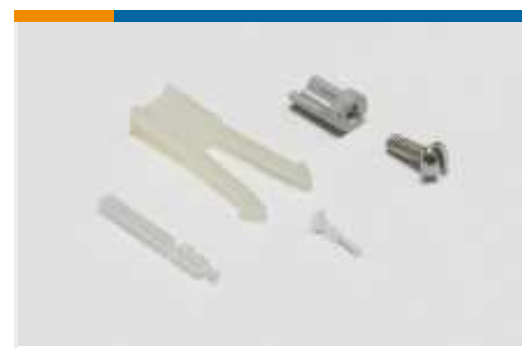
Kodierungen für Leiterplatten-Steckverbinder(2)