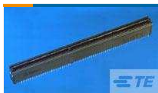
TE Teilenummer5145251-3 AMP 1MM STD EDGE 242 POS