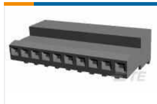
TE Teilenummer4-643498-0 10P MTA100 CONN ASSY BLK LF