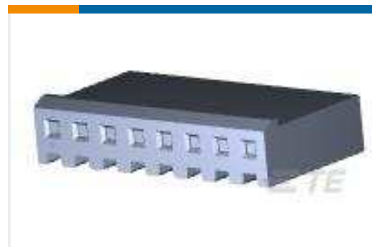
TE Teilenummer647401-8 08P SL156 HSG W/RAMP,LRG OPEN