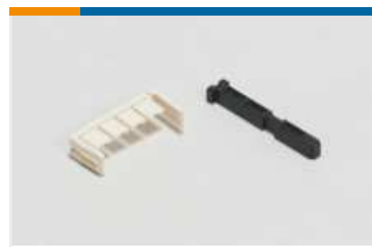
Kodierstifte für rechteckige Steckverbinder(1)