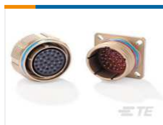
TE TeilenummerZPF000000000088735 DTB 26 B 19-11 SN