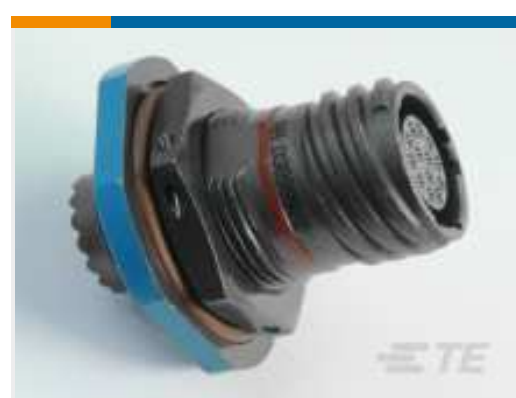
TE Teilenummer YDTS24Z15-15SNC001 RECP ASSY