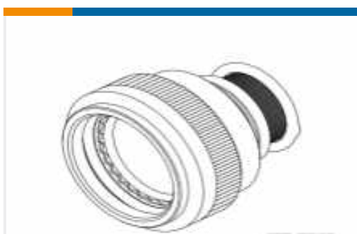
TE TeilenummerCW1053-000 TXR40AZ00-1207BI