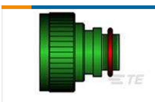
TE TeilenummerCW1070-000 TXR40AZ00-1812BI