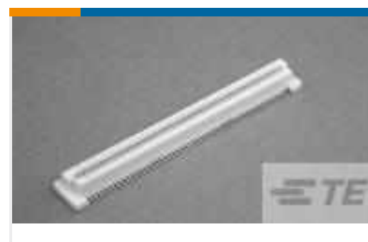
TE Teilenummer3-1735481-0 0.8FH,R17H.5,200,30/Sn,TU,SC