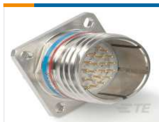
TE Teilenummer YDTS20Z15-15SNC001 RECP ASSY