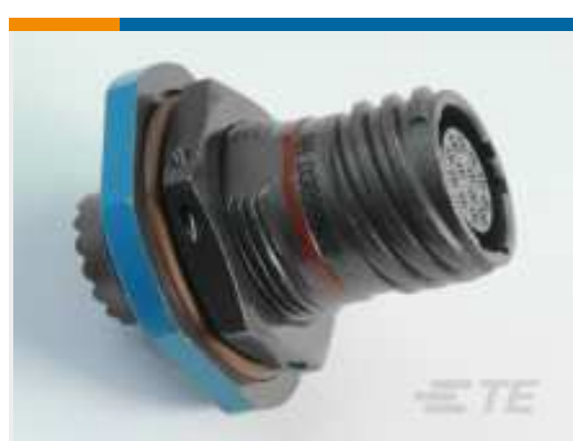
TE Teilenummer YDTS24Z15-15SNV001 RECP ASSY