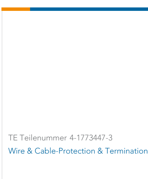
TE Teilenummer 4-1773447-3 Wire & Cable-Protection & Termination