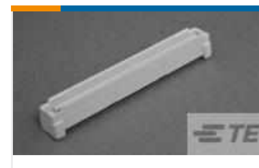
TE Teilenummer3-5179030-0 0.8FH,P07H.5,200,30/Sn,TU,SC