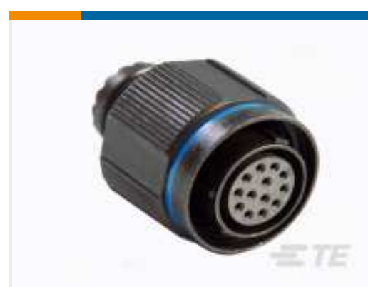
TE TeilenummerYDTS26Z15-15PAV001 PLUG ASSY