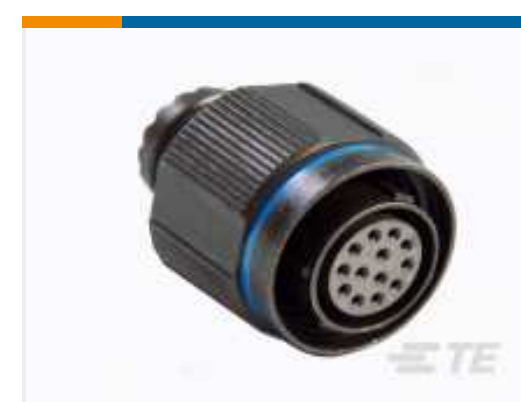
TE TeilenummerYDTS26Z17-99PAV001 PLUG ASSY