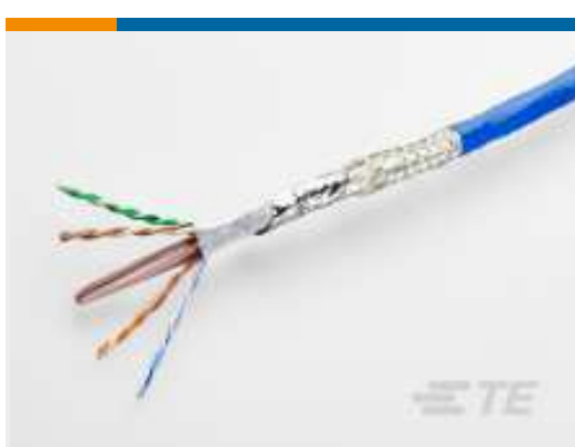
TE TeilenummerCQ60503001 C6A-24B134XN18A-0CK9500