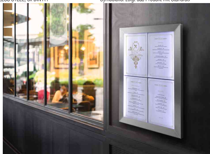
Visuel de référence: exemple d'utilisation