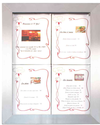
LED-Schaukasten STAINLESS STEEL, 4x DIN A4