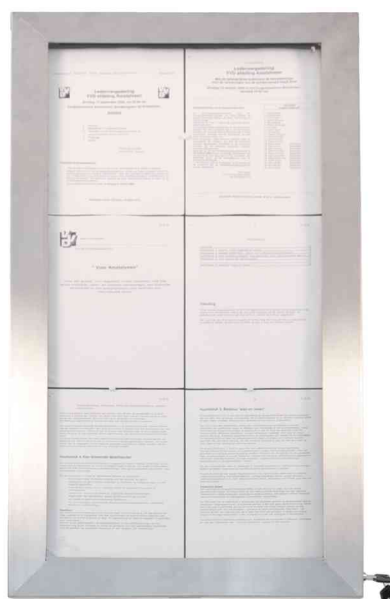
LED-Schaukasten STAINLESS STEEL, 6x DIN A4